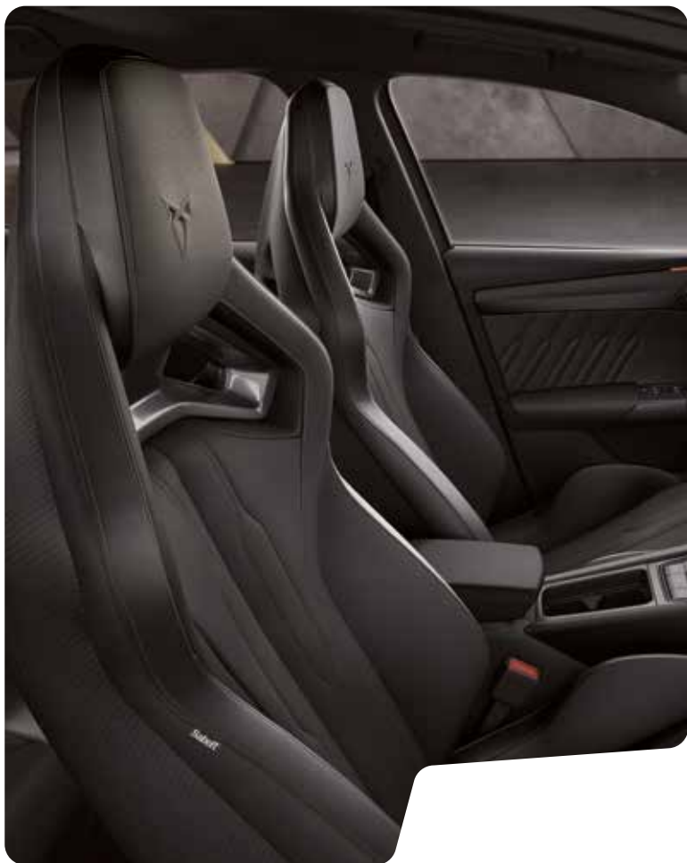
← SKÅLADE SÄTEN I ÄKTA LÄDER BLACK 1 VZ CUP