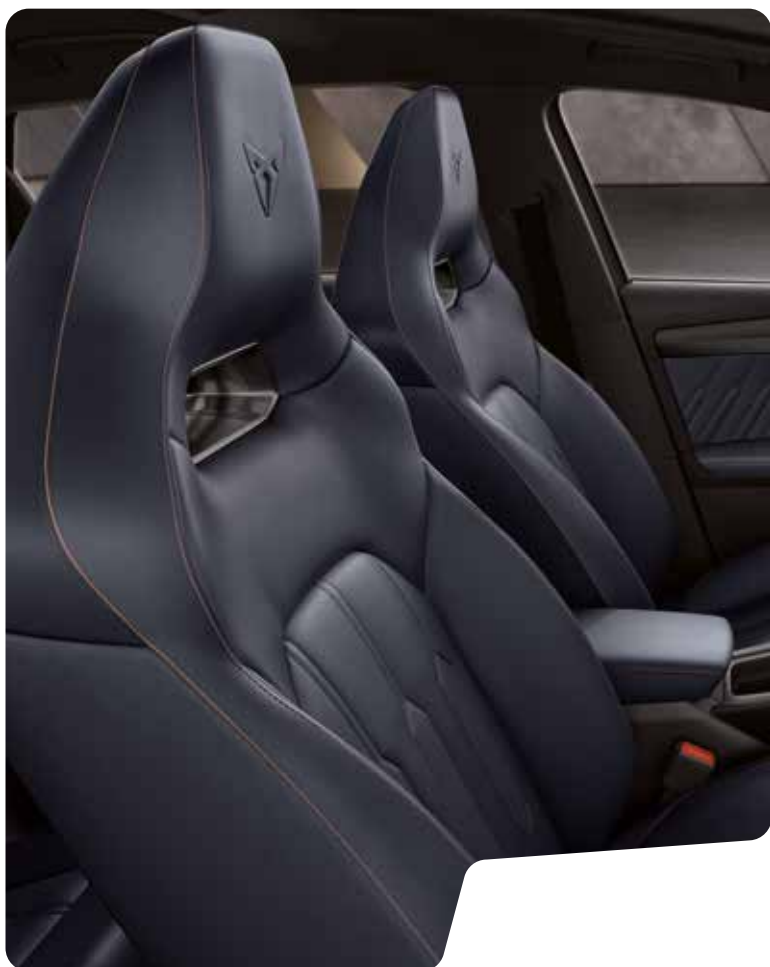
→ SKÅLADE SÄTEN I ÄKTA LÄDER I PETROL BLUE L VZ