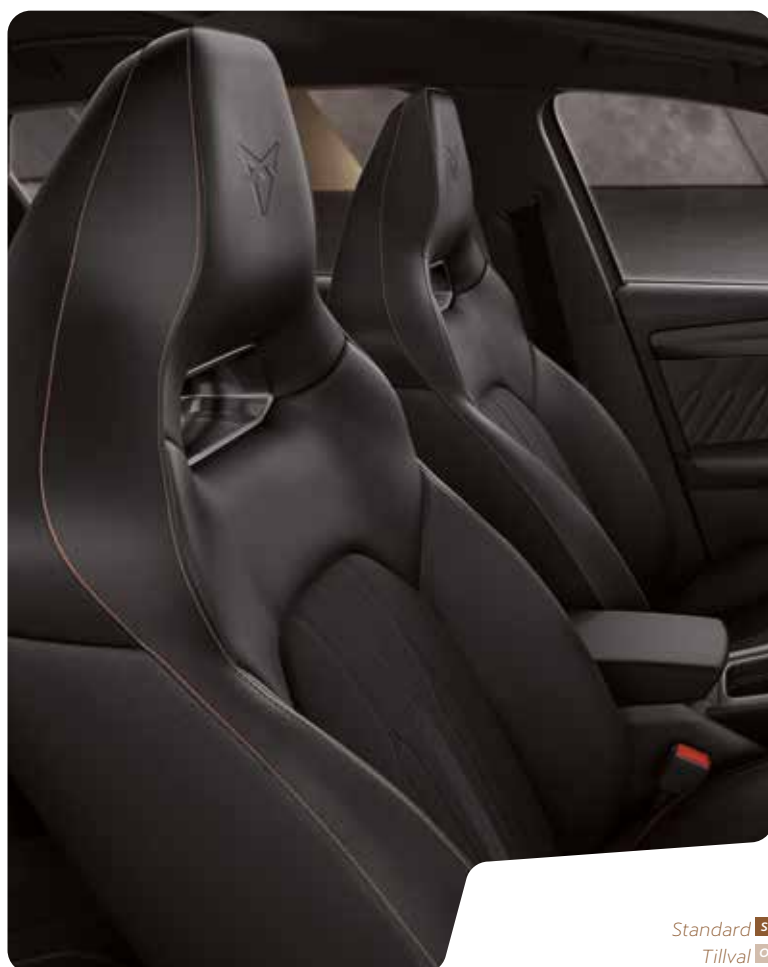
→ SKÅLADE SÄTEN I TYGET SHARP VZ L