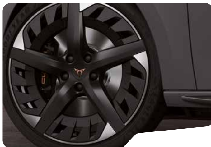
↓ 19" AERO SPORT BLACK OCH COPPER 1 P8W VZ