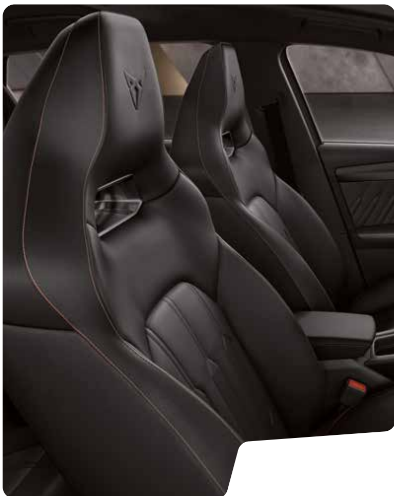
← SKÅLADE SÄTEN I ÄKTA LÄDER I BLACK L VZ