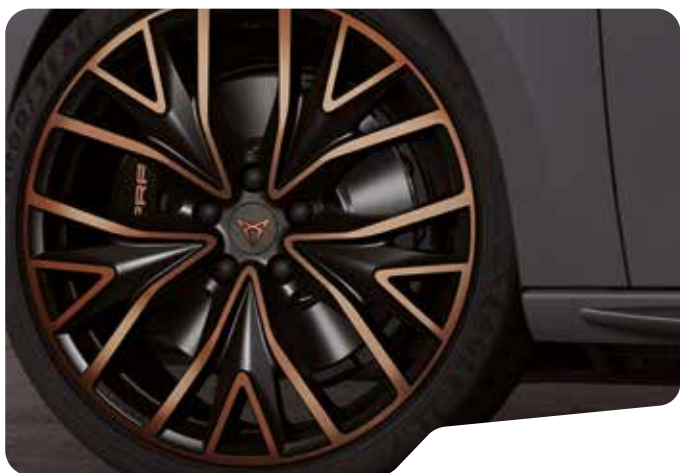
↑ 19" PERFORMANCE SPORT BLACK OCH COPPER PYA VZ CUP VZ