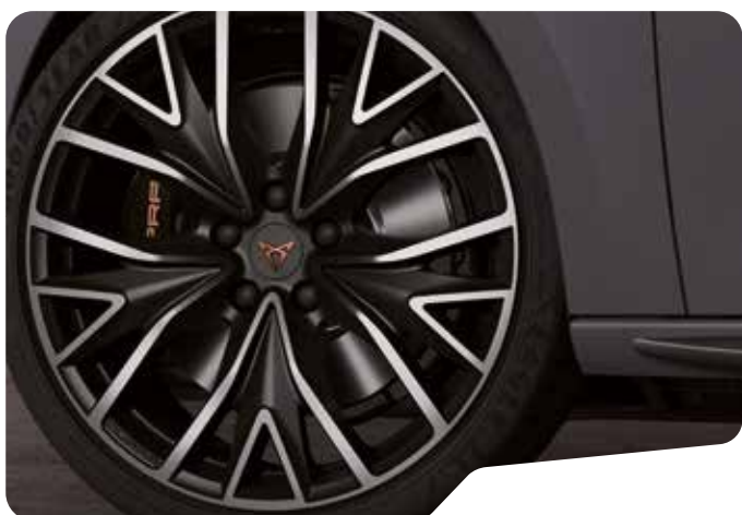
↑ 19" PERFORMANCE SPORT BLACK OCH SILVER PYB VZ